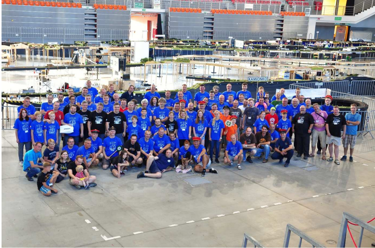
Uczestnicy zlotu 2018 / Group photo 2018