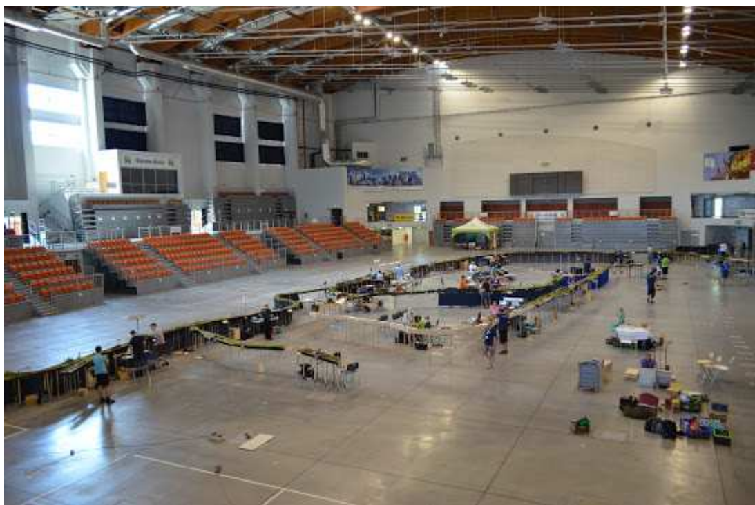
Hala wewnątrz / Hall BBOSIR inside.