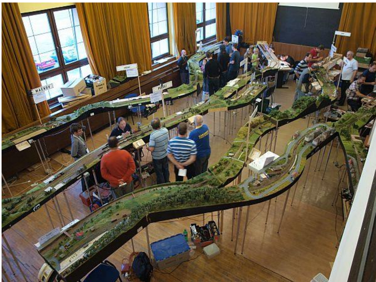
Snímek pořízen s nasazením vlastního života z ribstolí nad stanicí Podolí

No a jak to tedy vlastně dopadlo, když jsme to postavili? No tak se tedy konečně mrkněte na fotku, vy zvědavci. Stejně je mi jasné, že na ní čekáte víc, než na ty řeči kolem :-)