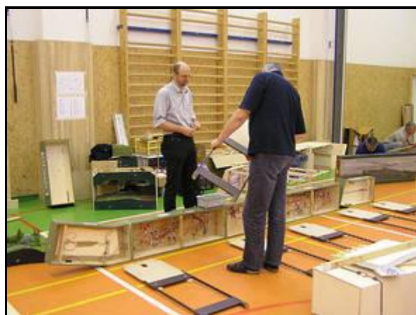
Jako první vždy probíhá kompletace stanic