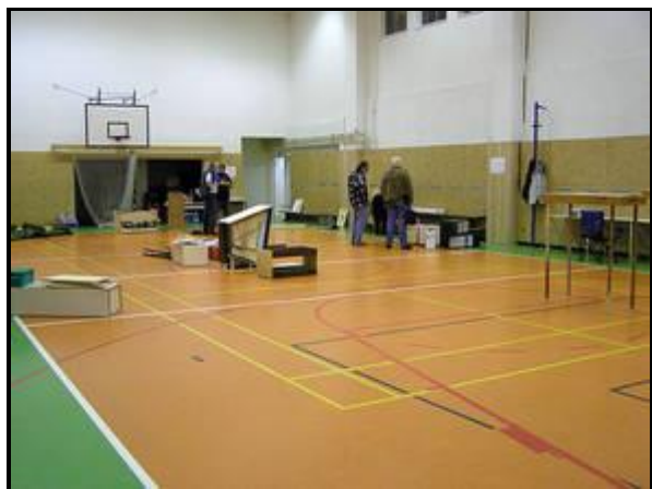
Foto 1: První prohlídka připravených provozních pomůcek. Netušil jsem, že český sešiták bude pro Němce tak zábavným čtením :-)