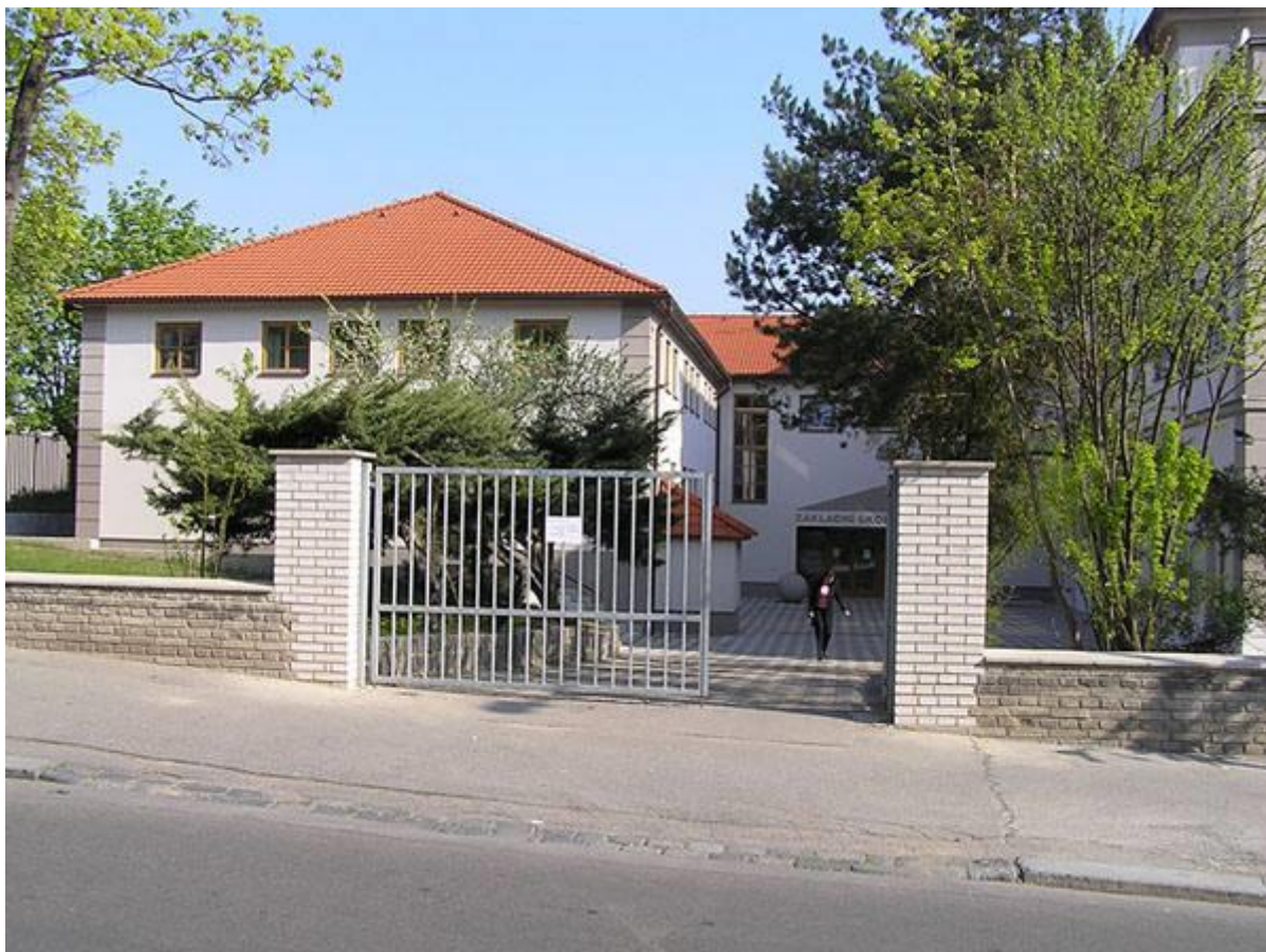
Základní škola Norbertov v pražských Střešovicích, v jejíž tělocvičně se setkání konalo

Ve stejné době byla provedena rezervace ubytovacích kapacit, protože přelom září a října je v Praze stále ještě obdobím turistické sezóny, takže shánět zde cenově přijatelné ubytování dva tři měsíce před setkáním by bylo velmi obtížné.